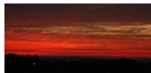
明日もまたネと子供と見た夕焼