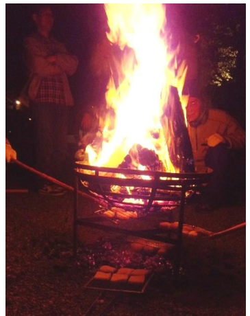
大晦日に息災を願って外宮での餅焼き風景（実は娘の撮影です）

社会が適切な労働環境を準備せず、それどころか低賃金・長時間労働を自己責任と、若者に強いるワーキングプアは、社会的無責任体制なのかと気付きました。そのツケ、過労死や自殺の増加として社会全体に回されます。原発政策の資金が、利用料金として薄く広く取られていた構造に似ていますね。消費税も同じ構造で利用されそうです。この本はさらに一人で生きにくい問題やDVにも話題が広がり、大人こそ読むべきかと思えます。